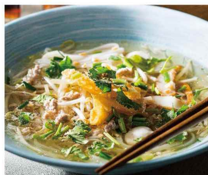
定番「センレック ナーム」 ▼ あっさりチキンスープの生米麺。