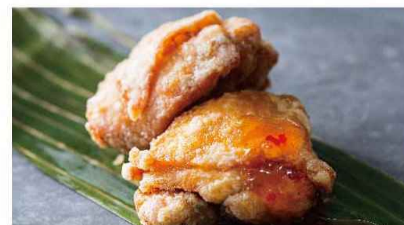
スリースパイスの ▼▼ フライドチキン(4ピース) ガイ トード ¥864