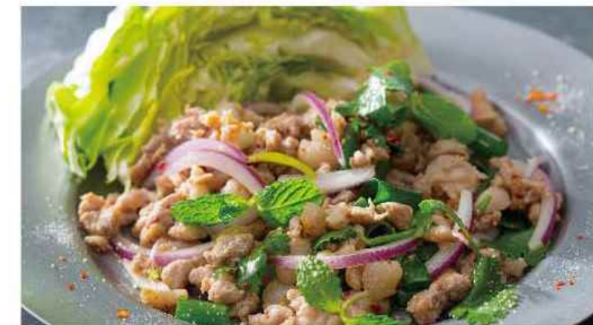
豚挽き肉のスパイシー ▼▼▼ ハーブ和え ラープ ムー ¥864