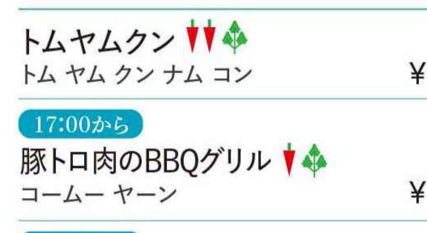
トムヤムクン ▼▼▼ トムヤムクンナム コン ¥1,257