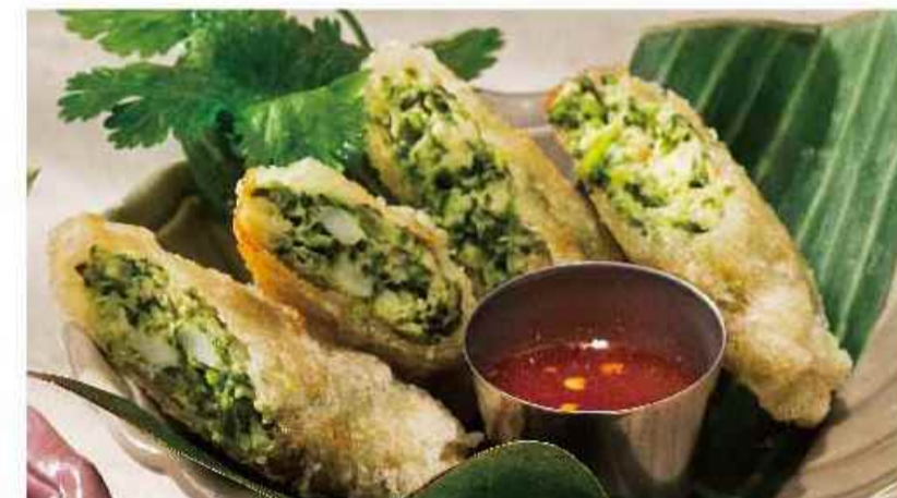
パクチー揚げ春巻き ▼▼ (4ピース) ポップア トード サイ パクチー ¥864