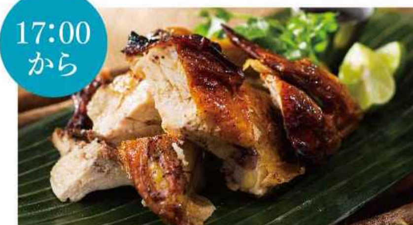
17:00 から 鶏のBBQグリル ▼▼ ガイ ヤーン ¥1,944