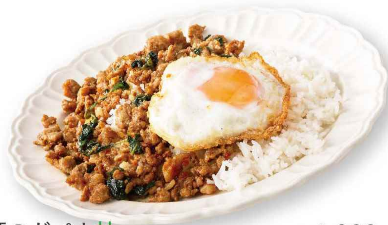
豚のガパオ ▼▼ カオ ガパオ ムー