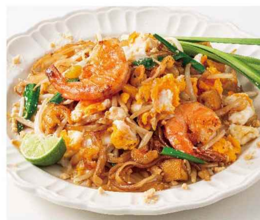
海老のパッタイ パツ タイ クン