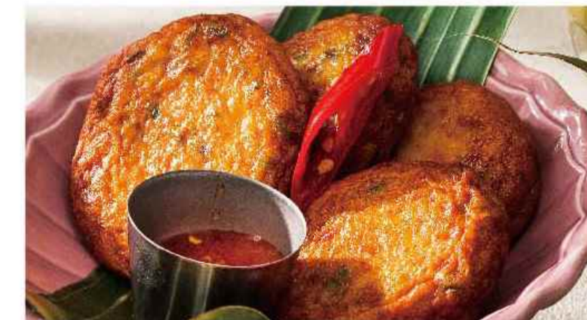
タイのさつま揚げ ▼ (4ピース) トード マンプラー ¥864