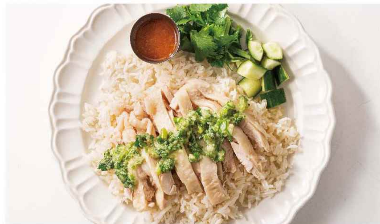
タイ産「米どり」のカオマンガイ ▼▼ カオ マン ガイ