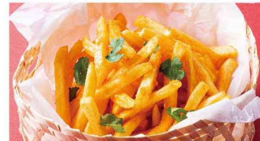
トムヤムポテト ▼▼ マンファラントードトムヤム ¥766