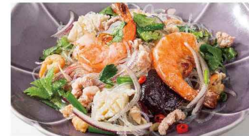
シーフードと春雨の スパイシーサラダ ▼▼▼ ヤム ウンセン ¥864