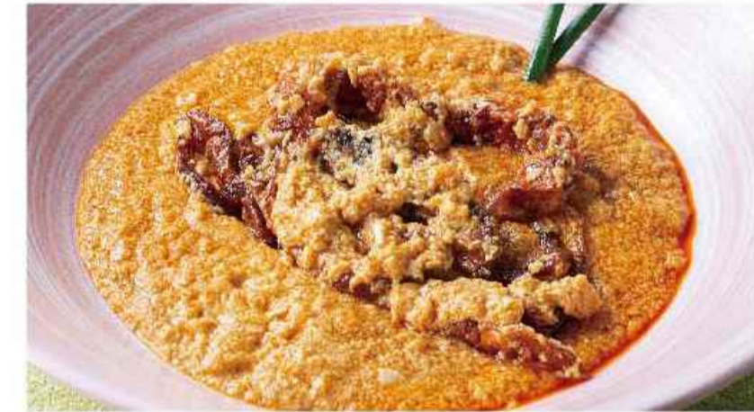
ソフトシェルクラブの ▼ 玉子カレー炒め プーニン パツ ポン カリー ¥1,748