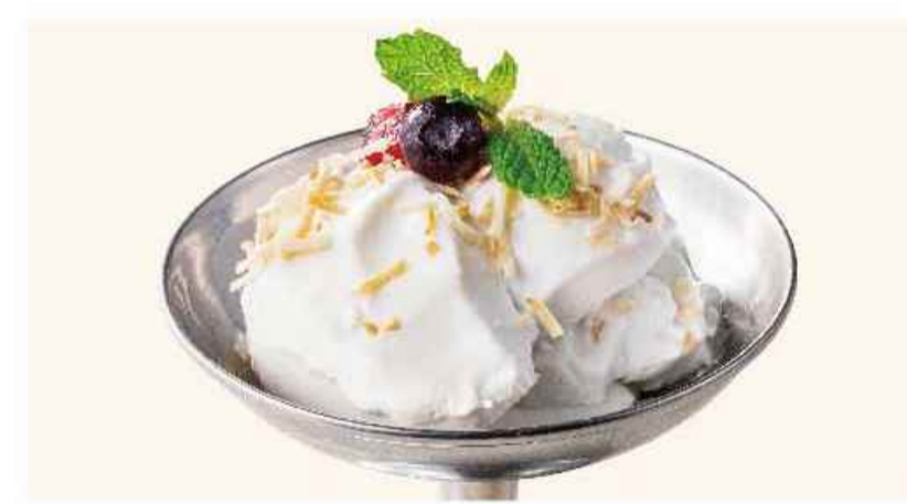
ココナッツパンナコッタ プディン ガティ ¥638