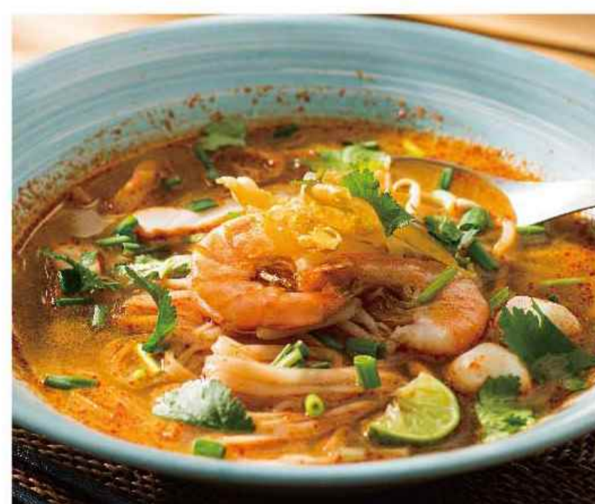
「センレック トムヤム」 ▼▼▼ 海老入りトムヤムスープの生米麺。