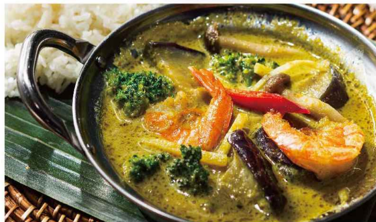
海老のグリーンカレー ▼▼▼ ゲーン キャオワンクン ※ジャスミンライス付き