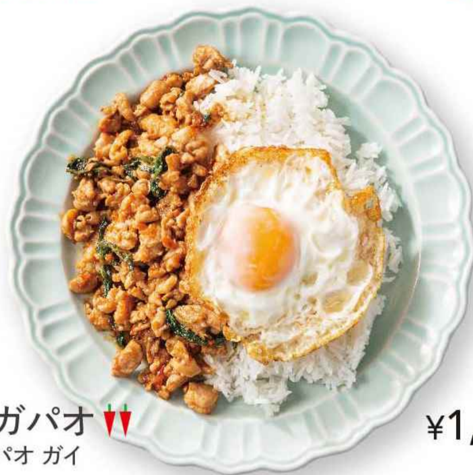
鶏のガパオ ▼▼ カオ ガパオ ガイ