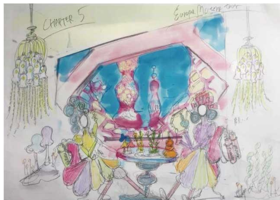
※イメージスケッチ