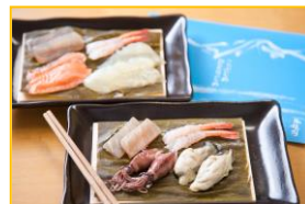
2017年 フード・ドリンク部門 グランプリ こぶじめ・ひとりじめ 株式会社かねみつ (富山県)