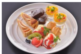
【スパニッシュ・イタリアン「バルコ」】 ドルチェ ミスト 1,620円

【対象店舗】スパニッシュ・イタリアン「バルコ」/TOKYO MERCATO/板前ダイニング するり/ MLB café TOKYO/マザー牧場 CAFÉ&SOFTCREAM/ハバガンブシュリンプ東京/ 海鮮三崎港/マリオンクレープ/HOT DOG STAND/い・か・金 (計10店舗) ※販売時間は店舗により異なる