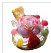
【マリオンクレープ】 ときめくスイーツクレープ 650円