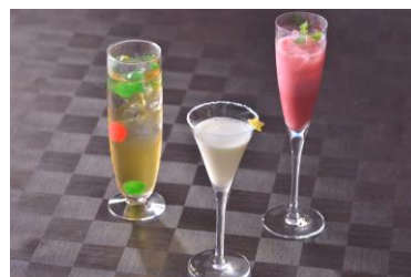
【アーティストバー「C Maj7」】 プロキオン/シリウス/ペテルギウス(左より) 各 1,296円