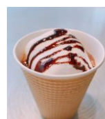
【い・か・金】 マシュマロホットチョコレート 380円