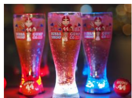
【ハバガンブシュリンプ東京】 フィジーファン 各 1,473円