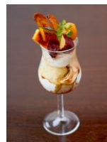
【板前ダイニング するり】 彩り極み和ぼふえ 1,296円