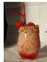
【MLB café TOKYO】 スウィート・ラバース 850円