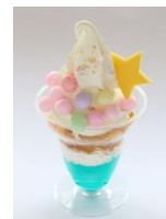
【マザー牧場 CAFÉ &SOFTCREAM】 キラふわパフェ 600円