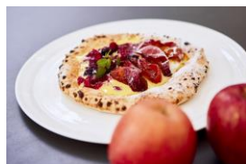
【TOKYO MERCATO】 ピッツァ メタメタ りんごとベリーの ハーフ&ハーフデザートピッツァ 1,200円