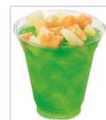
【HOT DOG STAND】 イルミネーションソーダ 350円