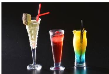
【バー「2000」】 ロミオ・メロン/レッド・クィーン/オランジェリーナ(左より) 各 2,160円 ※サービス料別

東京ドームホテルのバー「2000」やアーティストバー「C Maj7」では、『イルミネーションカクテル』を販売します。