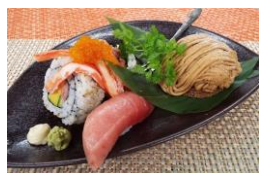
【海鮮三崎港】 スイーツ&ロール 鮭 702円