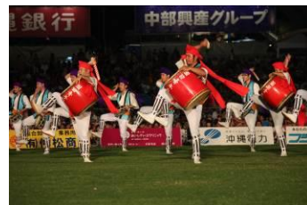
沖縄全島エイサーまつり (沖縄県)