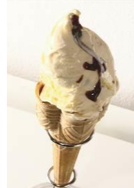
奥能登バナラ ワインジェラート