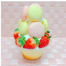
でらパフェ 名古屋マカロンタワー