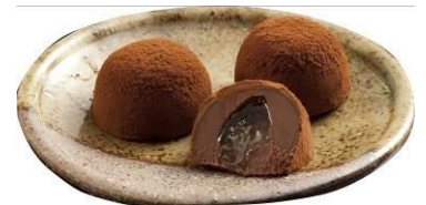
焼酎チョコ「伊佐美」