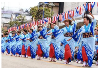
牛深ハイヤ祭り (熊本県)