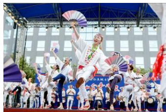
仙台すずめ踊り (宮城県)