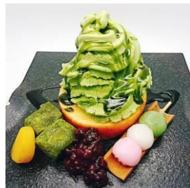
濃厚お抹茶玉露バウムパフェ