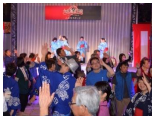
みんなで踊らナイト！

「お祭りを見るだけでなく、踊って楽しみたい」というお客様のために、「仙台すずめ踊り」や「牛深ハイヤ祭り」など、実際にご当地で踊りに参加できるお祭りを集め、一緒に踊っていただける「みんなで踊らナイト！」を1月18日(木)に開催します。本場の踊りをぜひ会場と一緒に踊ってお楽しみください。