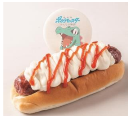
ワニノコみたい！？かみつくだッグ