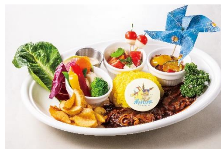
風の遊園地プレート