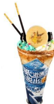
風の遊園地クレープ～チョコミントクレープ～