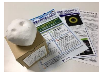
自由研究キット『リュウグウ模型を作って小惑星の研究者になろう！』イメージ