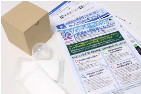
自由研究キット『リュウグウ模型を作って小惑星の研究者になろう！』イメージ

また、すでにお知らせしております、サイエンスエリア内にて公開中の『「はやぶさ2」 TeNQ特別展示』では、科学的に精巧に作られた「小惑星リュウグウの模擬地形」展示に加え、グローブボックスを使って模擬土壤を触る体験など、最先端の研究成果を体感いただけます。