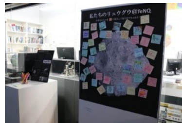
「はやぶさ2」 TeNQ特別展示の様子