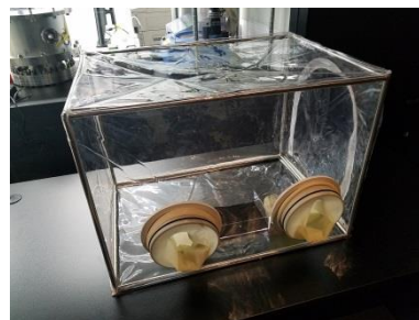
グローブボックスを使用して模擬土壤を触る様子