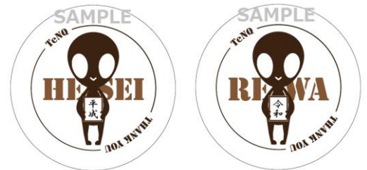
オリジナルクッキー イメージ

4月30日(火・祝)~5月2日(木・祝)の3日間、TeNQにちなみ、入館者各日先着109名様にTeNQオリジナルクッキーをプレゼントします。4月30日は「平成 テンキョウ 」、5月1日・2日は「令和」がデザインされています。