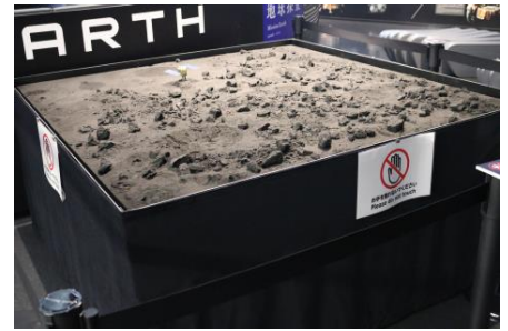
模擬土壌採取体験 イメージ