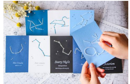
ワークショップ イメージ