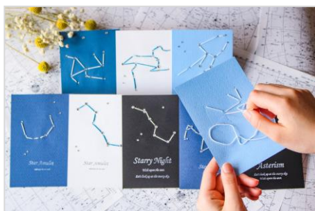
ワークショップ イメージ