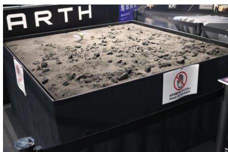
リュウグウ模擬土壌採取体験 イメージ

新元号がはじまるGWにTeNQでは、平成の時代に刻まれた宇宙史を振り返り、新しい時代の宇宙研究の発展や宇宙への夢を想像いただける企画の数々をご用意しました。リュウグウ模擬土壌採取体験や宇宙服素材を使ったワークショップなど多彩な体験イベントを展開するほか、5月5日(日・祝)の「こどもの日」は、0歳から入館いただける(通常は4歳未満入館不可)ファミリーデーの実施に加え、3歳までのお子様は無料(通常は500円)で入館いただけます。また、“平成最後の日”と“令和の初日・2日目”限定で元号にちなんだオリジナルノベルティを先着でプレゼントするキャンペーンのほか、TeNQリサーチセンター監修の天体解説付きチョコレートの販売を行うなど、様々なイベントを実施します。