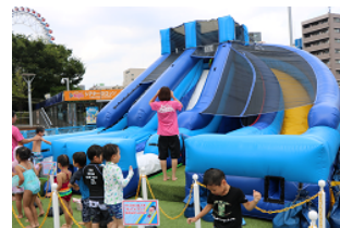
【ざぶ～んダブルスライダー】