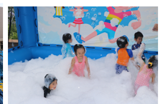
【あわあわホイップ】

エリア内には更衣スペースをご用意しています。プールではなく水遊び広場ですので、サンダルなどの履物を履いてご利用ください。その他、ご利用上の注意事項は公式サイトにてご確認ください。