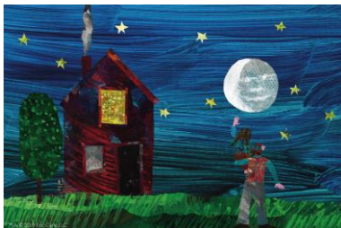
「パパ、お月さまとって！」