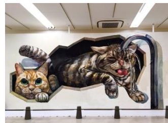
©ねこ休み展 夏 2019/ チョーヒカル×なごむ&きなき 超巨大壁画 イメージ