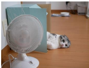
新作写真作品 イメージ