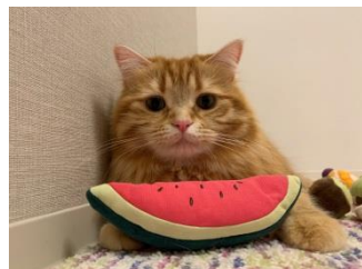
新作写真作品 イメージ