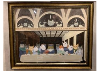
スター猫の晚餐