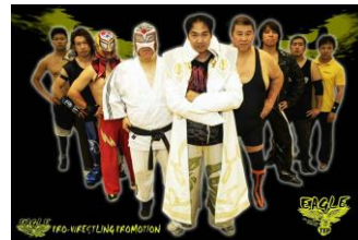
イーグルプロレス (栃木県)

◎出場団体(第一弾): 北都プロレス(北海道)、プロレスリングDEWA(山形県)、イーグルプロレス(栃木県)、チームでら(愛知県)、リアル・ルチャ・リブレ(福岡県)、琉球ドラゴンプロレス(沖縄県)