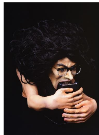
記念すべき第1作目「俺ハンテープ」