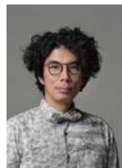
片桐 仁(お笑い芸人・俳優)

■お客様からのお問い合わせ先: 東京ドームシティわくわくダイヤル TEL.03-5800-9999