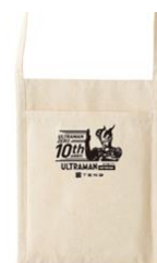
サコッシュ(イメージ)