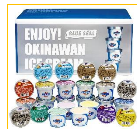
ブルーシール 詰合せギフト (沖縄県)