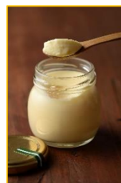
なかほら牧場プリン (岩手県)