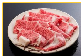
近江牛霜降すき焼きセット (滋賀県)