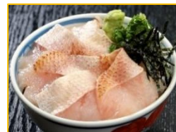
のどぐろ丼 (島根県)