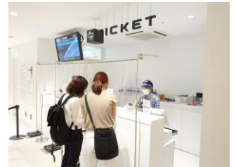
チケットカウンターの様子