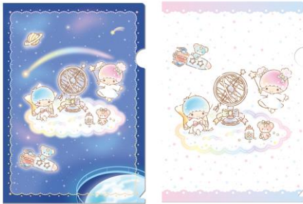
オリジナルクリアファイル(イメージ)