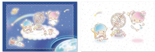
オリジナルポストカード(イメージ)