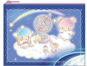
オリジナルポーチ(イメージ)