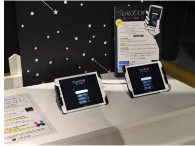
前回のアプリ体験の様子