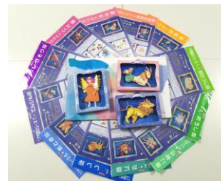
12星座ペーパークラフト