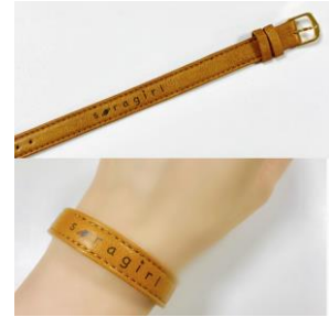
ビクセン 宙ガールリストバンド