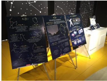
前回のパネル展示の様子