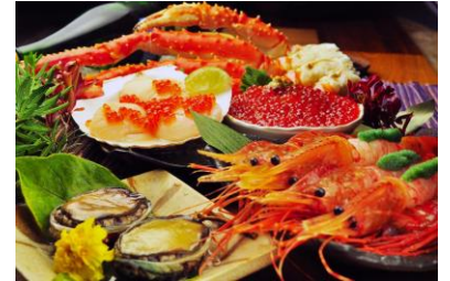
プレミアム海鮮セット(イメージ)

そのほか、もれなく皆様にラクーアご利用券100円分をお渡しします。バルミューダ ザ・ポット(イメージ)