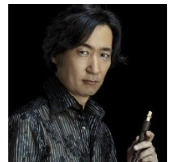
東儀 秀樹 (雅楽師)