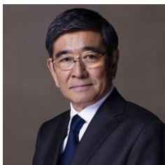
石坂 浩二 (俳優)

各界の著名人による日々の暮らしを彩る食空間提案を、過去のアーカイブギャラリーとして、ご本人からのメッセージと共に紹介します。