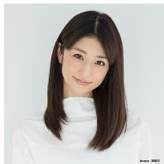
小倉 優子 (タレント)