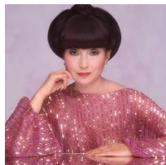
黒柳 徹子 (女優・ユニセフ親善大使)