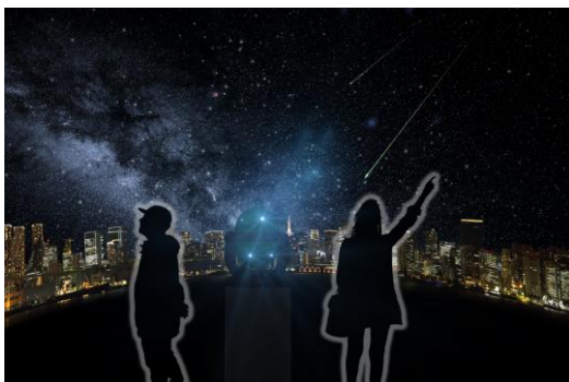
オリジナルアロマの香りとともに楽しむ 夢幻宇宙ゾーン(イメージ)

TeNQでは、新型コロナウイルス感染状況に関する政府および東京都の方針を鑑み、十分な感染症予防対策を実施した上で営業しております。お客様とスタッフの安全・安心を守るための主な感染症予防対策につきましては、本リリースの最終ページをご覧ください。