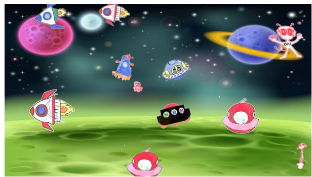
デジタル宇宙ぬりえ(イメージ)