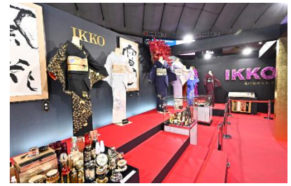
前回の展示作品 (世界らん展 2020 会場内)