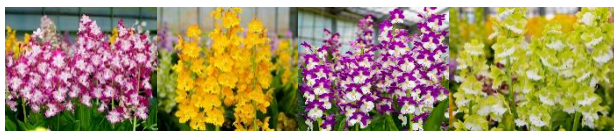
展示予定花 えびね

世界らん展で初となる「えびね」が咲き誇るランウェイ。交配を重ねて、赤・黄・紫などカラフルになった日本の蘭「えびね」が、カーブを描いた小道を囲みます。歩いて楽しく、春のお花畑にいる気分を満喫できます。満開のえびねをバックに写真が撮れるフォトスポットも。