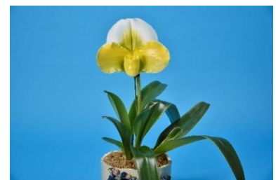
2020 年 日本大賞受賞花 パフィオペディラム ツクバ スウィート “ヒサシ”

大賞賞金 200 万円！日本中から数百の蘭を一堂に集めた世界最大級のコンテストです。蘭愛好家が長い時間をかけて育てた渾身の作品の中から、厳正な審査を経て、今年の日本一となった受賞花を決定します。技術と情熱が注ぎ込まれた「花の芸術作品」の数々をご覧ください。