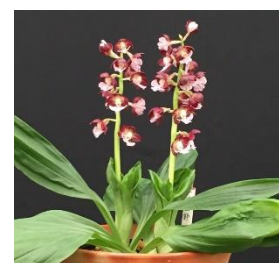
展示予定花 一寸法師