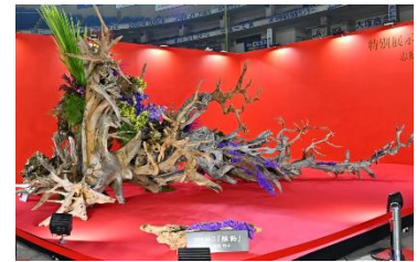
前回の展示作品 (世界らん展 2020 会場内)