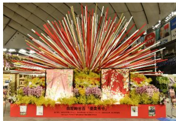
前回の展示作品 (世界らん展 2020 会場内)