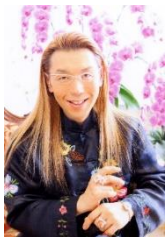
假屋崎 省吾 (華道家)

各回1時間半程度。夜間開催日の 26・27 日は、上記に加えて⑤17:30～ ⑥19:30～も予定。