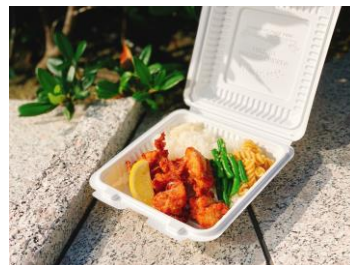
キッチンカー メニュー(イメージ)