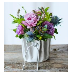
青山フラワーマーケット フラワーアレンジメント(イメージ)

ラクーア ショップ&レストランの対象店舗またはスパ ラクーアにて、1会計1,000円(税込)以上のご利用で1スタンプがもらえます。3店舗分のスタンプを集めて応募用紙を投函すると抽選で豪華賞品が当たります。