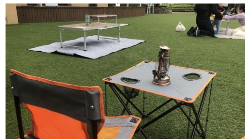
ラクーアガーデン芝生広場イベント(イメージ)