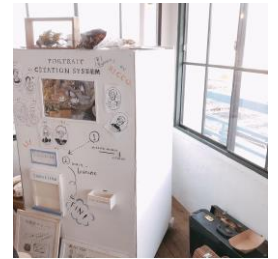
似顔絵マシン(イメージ)