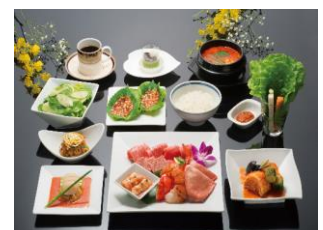
「叙々苑」メニュー(イメージ)