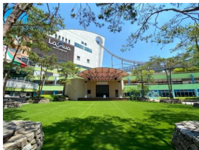
ラクーアガーデン芝生広場

さらに、期間中は豪華賞品が当たるスタンプラリーの実施や、スパ ラクーアでは、母の日に合わせた割引キャンペーンとして、期間限定で母と娘で来館されたお二人分の入館料をサンキューにちなみ特別価格3,900円で提供するなど、18周年を盛り上げるさまざまな企画を展開します。