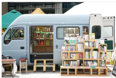
「BOOK TRUCK(移動本屋)」(イメージ)