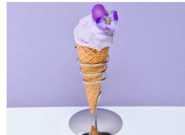
キッチンカー メニュー(イメージ)