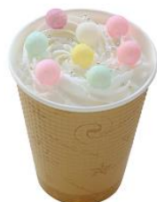
キラキラ☆ウインナーコーヒー