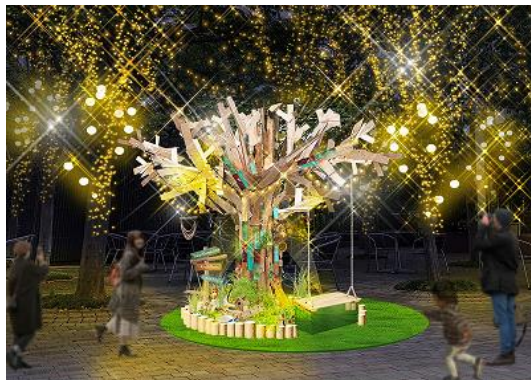
イルミネーション自体の撮影やブランコに座っての記念撮影もお楽しみいただけます

全体の写真を撮ったあとは、もっとオブジェに近づいてみましょう。オブジェの周りでしゃがんで見ると、そこにはツリーや雪だるまが置かれています。リスたちが作ったものでしょうか。木の幹には、リスたちの隠れ家も。廃木材の木に命を吹き込むリスたちを追いかけて、様々な角度からあなただけの写真ポイントを探してみてください。足元の小さな切り株は、お客様がお持ちになったイベントアイテムの人形にジャストサイズかもしれません。