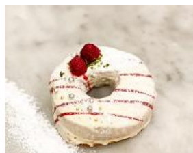
ホワイトフランボワーズ