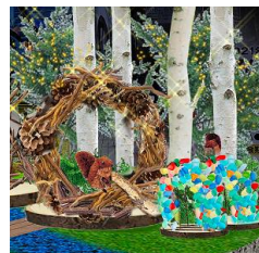
様々な被写体とともにオリジナルの記念撮影をお楽しみください