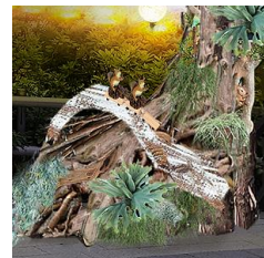
ウッドフレーム越しに素敵な記念撮影をお楽しみいただけます