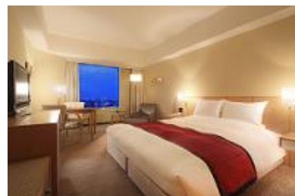
客室例 デラックスダブルルーム