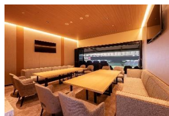
THE SUITE TOKYO(個室)