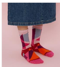
靴下・トンガリヒルズ