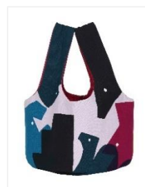
鞆・HOP STEP LIFE