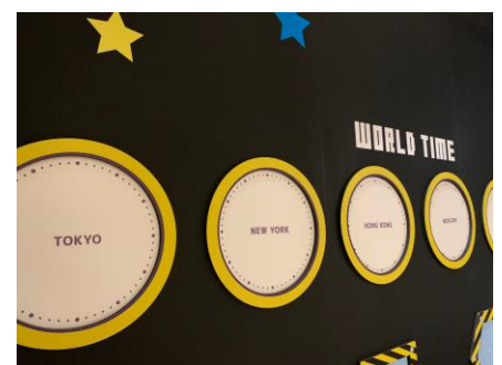
「前回のイベントの様子」