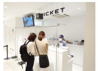
チケットカウンターの様子