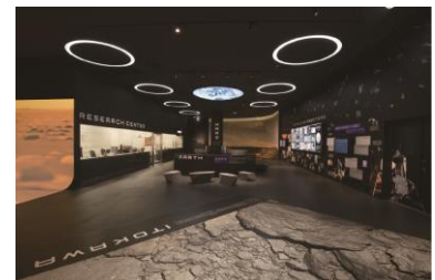
サイエンスエリア