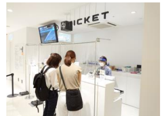
チケットカウンターの様子