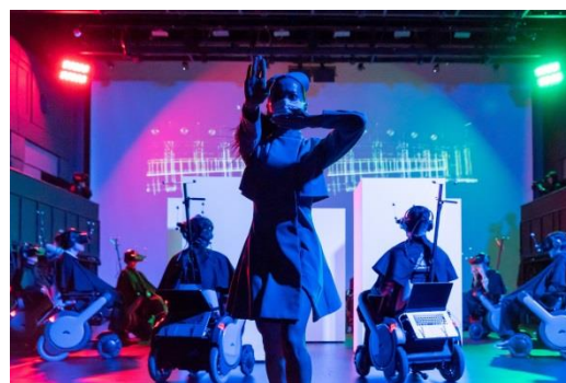
Rhizomatiks Research×ELEVENPLAY 『border』(2015) 2015