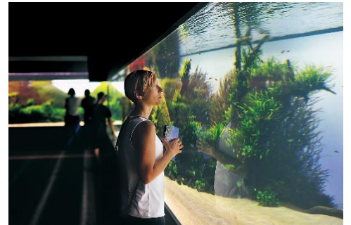
リスボン海洋水族館収容40m作品 「水中の森」