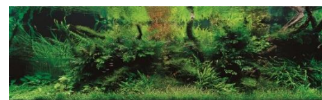
ネイチャーアクアリウム作品