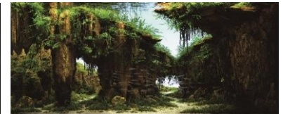
2016年グランプリ作品