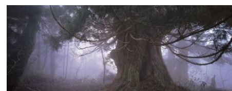
佐渡原始杉の超特大写真パネル