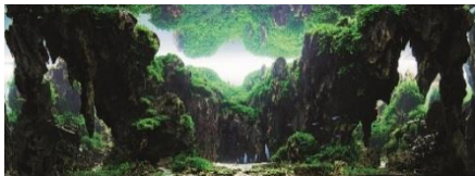
2014年グランプリ作品

史上初となる世界規模の水草レイアウトコンテストとして、ADA主催で2001年より毎年開催されている。2017年には世界66の国と地域から2,056作品の応募があった。グランプリをはじめとした上位入賞はアクアリウム業界のステータスとされ、多くの受賞者が世界で活躍している。