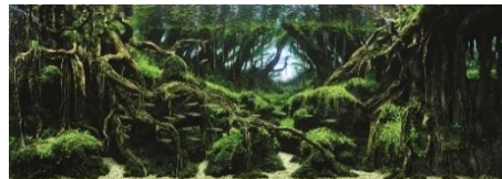
2015年グランプリ作品