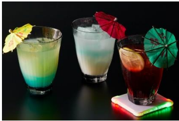
和食「春風萬里」 冬桜／冬富士／ペテルギウス ※画像左から 各 880円 ※サービス料別