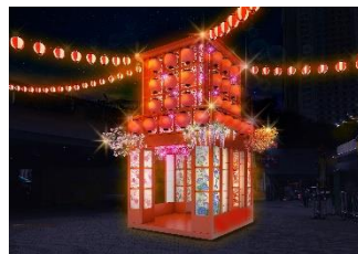
祭りやぐら(イメージ)