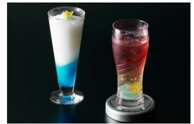
バー「2000」 <第1弾 11月13日～12月19日> 冬空／七星幽(しちせいゆう) ※画像左から 各 1,980円 ※サービス料別 (第2弾も実施予定)