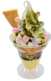
マザー牧場 CAFE&SOFTCREAM 和(なごみ)パフェ 600円