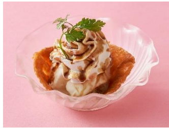
海鮮三崎港 いなりアイスクリーム 209円