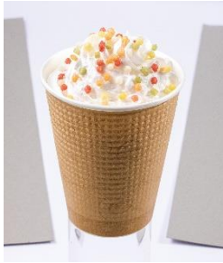
HOT DOG STAND 彩りほうじ茶ラテ 460円