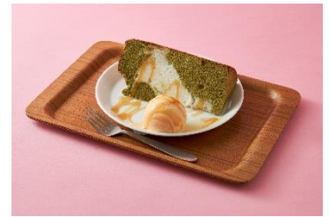
nana's green tea シフォンケーキバニラ添え 660円