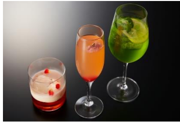
アーティストバー「C Maj7」 紅富士／「Sakura」Belini／Bamboo Leaf ※画像左から 各 1,650円