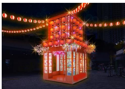
祭りやぐら(イメージ)

そのほか、東京ドームシティ内の植栽などにもLED電球の装飾を施し、東京ドームシティ全体がイルミネーションに包まれます。