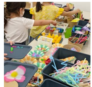
ティンカリングビュッフェの様子