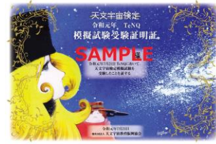
松本零士氏のイラスト付き受講証(イメージ)