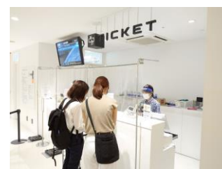
チケットカウンターの様子