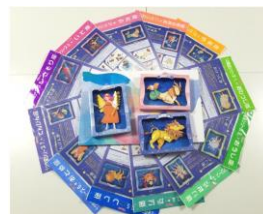
12星座のペーパークラフト(イメージ)

※今後の社会状況により、会期・内容が変更になる場合がございます。最新の状況は、公式ホームページでご確認ください