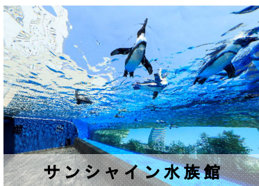
サンシャイン水族館