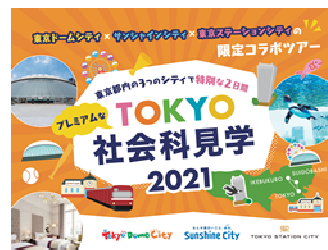
3シティ連携 キービジュアル