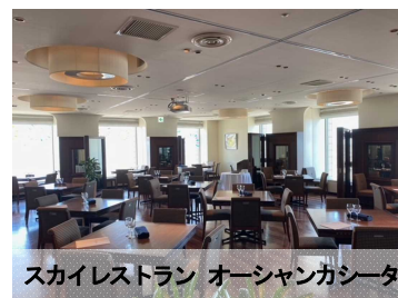
スカイレストラン オーシャンカシータ