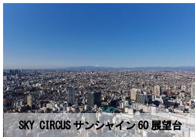
SKY CIRCUS サンシャイン60 展望台