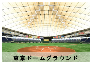
東京ドームグラウンド