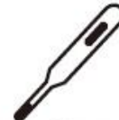
出勤時の体温チェック