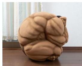
球体ビスケット・オリバ イメージ