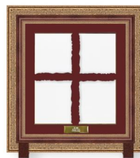
「範馬勇次郎サイン」イメージ