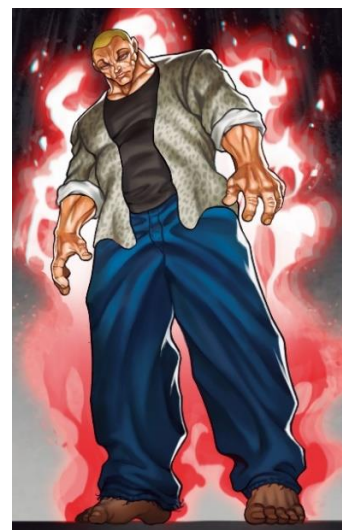
ジャック・ハンマー ©板垣恵介(秋田書店)1992

この度、板垣恵介先生直筆サイン入りの認定書が付いた「範馬勇次郎サイン」を板垣先生から直接受け取ることができるリターンなど、新たに5つのコースの追加が決定しましたのでお知らせすると共に、11月16日(火)19:00から受付を開始します。