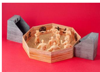
刃牙消しセット(クラウドファンディング限定 地下闘技場付き) イメージ