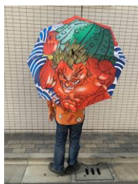
雨傘・侠客立ち(クラウドファンディング限定カラーリング) イメージ