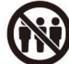
混雑時の入場制限