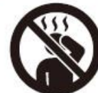
体調不良時のご来場はお控えください