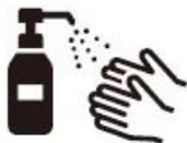
手洗い・うがい・手指の消毒