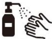
手洗い・うがい・手指の消毒