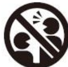
大声での会話はお控えください