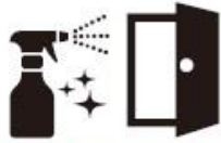
施設の定期的な消毒