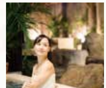
※因拍攝關係，會圍著浴巾。

東京Dome City 地底下1,700公尺處湧出的天然溫泉，因保濕、保溫效果顯著，被稱作是「瘦身湯」「美人湯」。露天浴池以檜木製成，可享受促進新陳代謝並具美容功效的「碳酸泉」。室內浴池為「氧氣泉」。